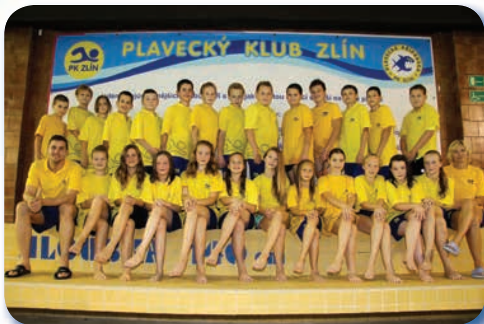
5. + 6. sportovní plavecká třída