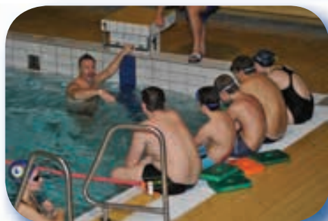
Praktická ukázka při tréninku