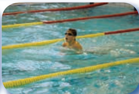
Na poháru Moravy 11.letých Brno