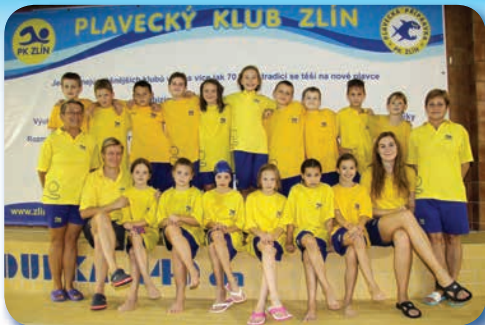
4. sportovní plavecká třída