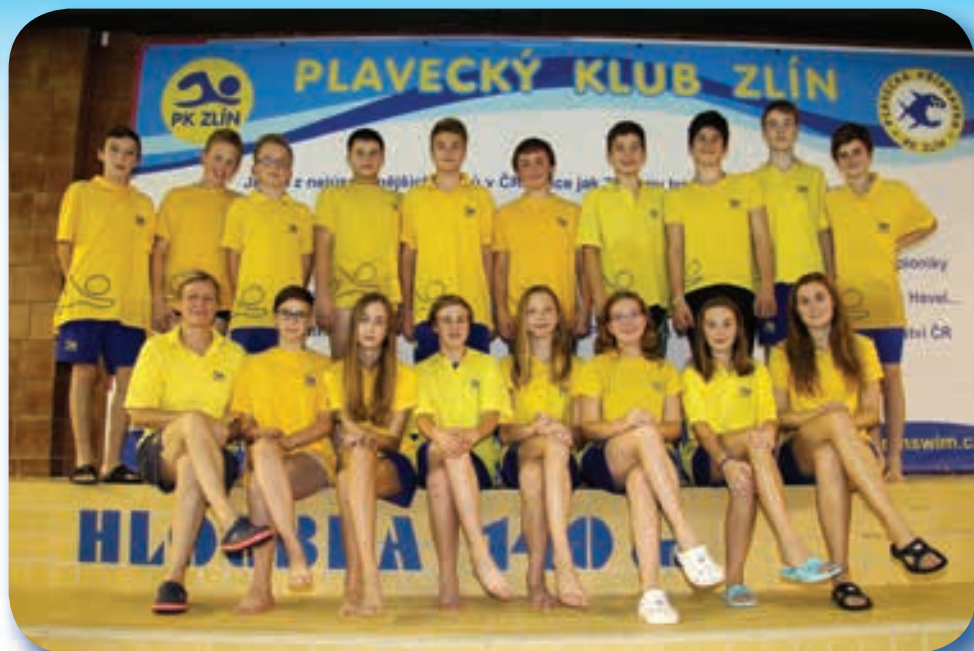
7. + 8. sportovní plavecká třída