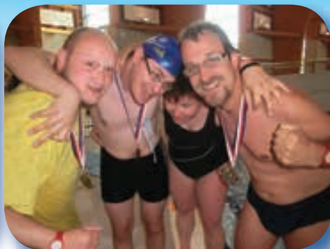
Tým Naděje na Mistrovství Moravy a Slezska v Přerově