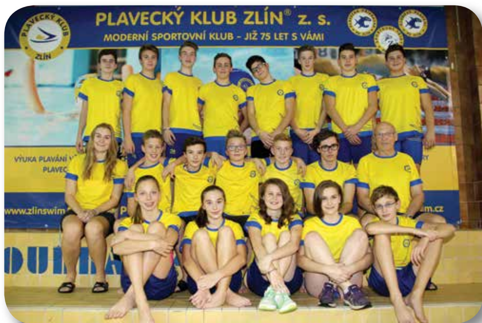
8. + 9. sportovní plavecká třída