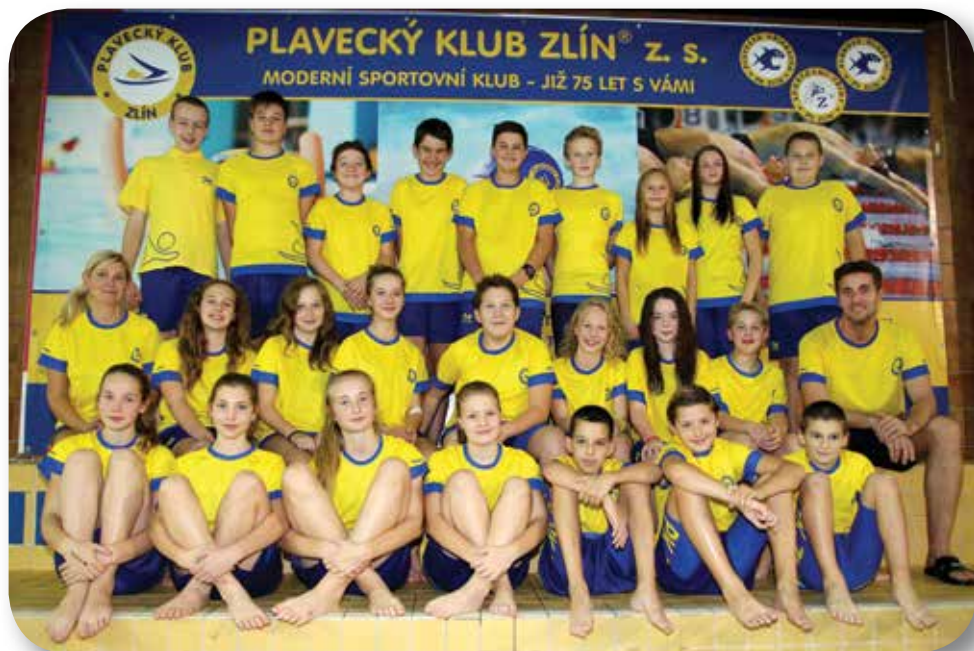
6. + 7. sportovní plavecká třída