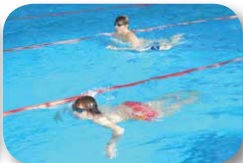
Trojtkáni Zlín - UH - UB