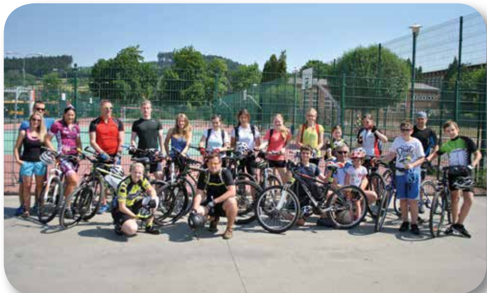
Cyklovýlet na RS Revika do Vizovic